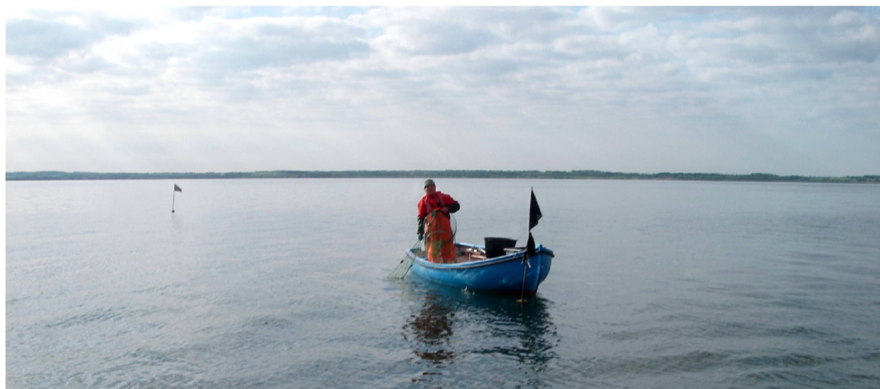
Nøglefiskerne fisker i fjorde, vige eller ved den åbne kyst.