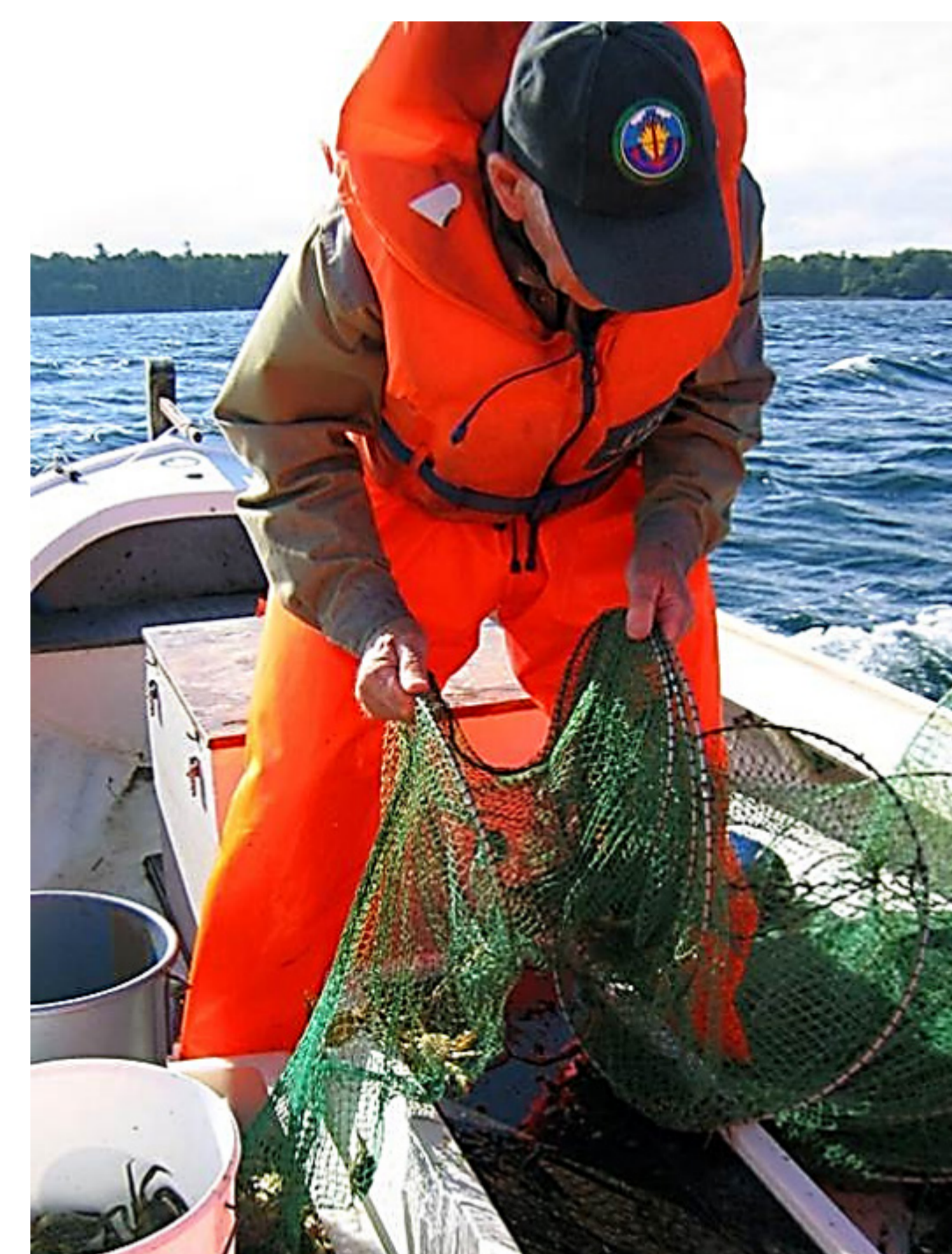
Nøglefisker røgter ruse.