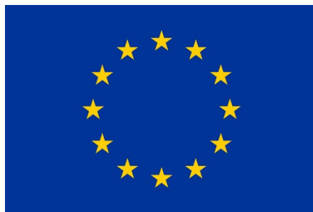
Den Europæiske Union Den Europæiske Hav- og Fiskerifond