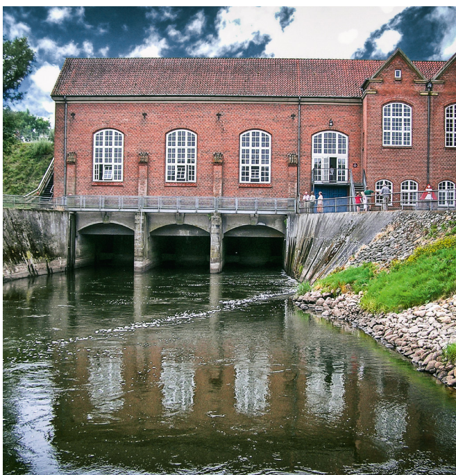
Det gennemsnitlige smolttab ved vandkraftværker er så højt som 82 %.