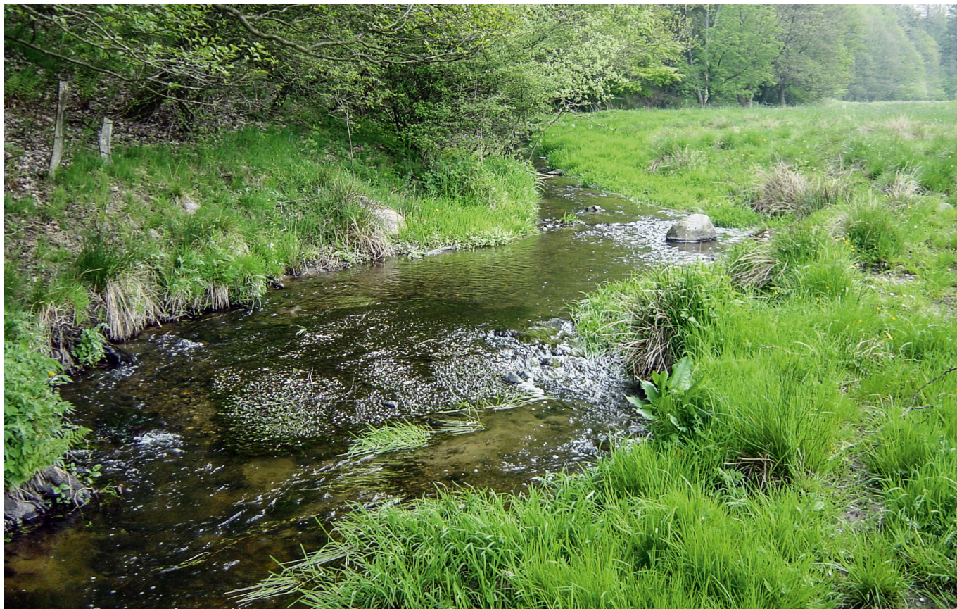
De små ørredbække har stor værdi for samfundet. Produktionen af havørredyngel i en god ørredbæk skaber en årlig omsætning ved lystfiskeri efter havørred et sted i Danmark på mindst 283.000 kr pr. km gydevandløb.

højt (Hasler et al. 2016) – men indtil videre er der ikke beregnet andre referencetal for værdien af det danske havørredfiskeri.