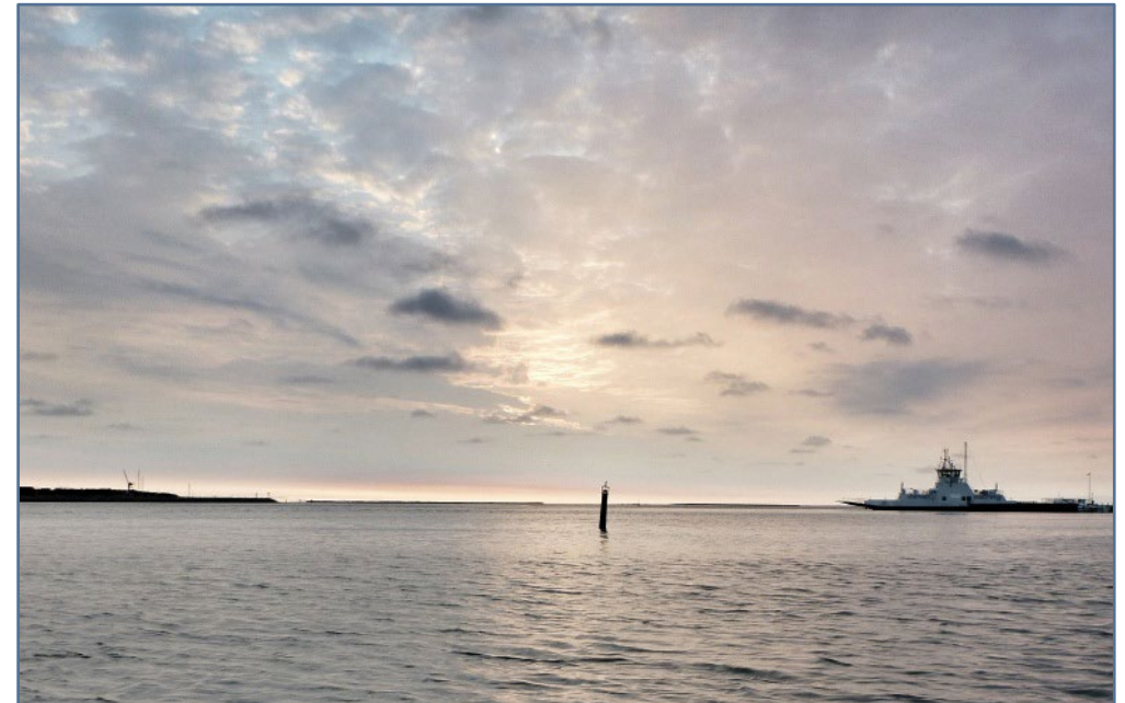
Folderen er blevet til i samarbejde med Randers Fjord Fritidsfiskerforening og Fiskeristyrelsen

Vær opmærksom på at den til enhver tid gældende fiskerilovgivning, også omfatter fiskeri i Randers Fjord!